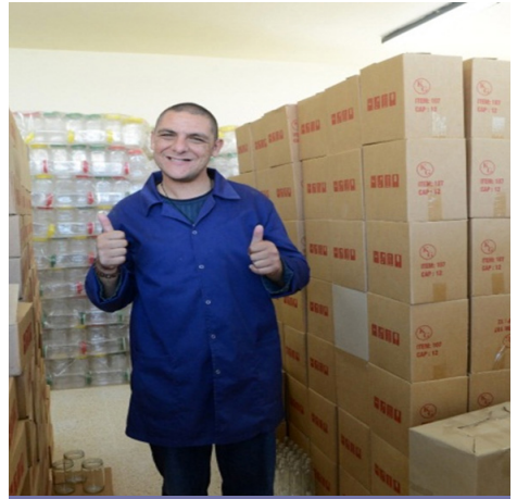
نقل إلى المستودع

كما يتم تحضير وتنسيق الأعياد والمناسبات بدقة لكي تنطبع بالذاكرة.