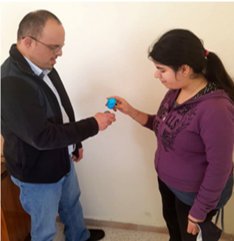
مركز المساعدة بالعمل - كفرحونا 2-

ونعمل على حلقات تربية وترفيهية لتجديد النشاط وخلق روح الفرح.